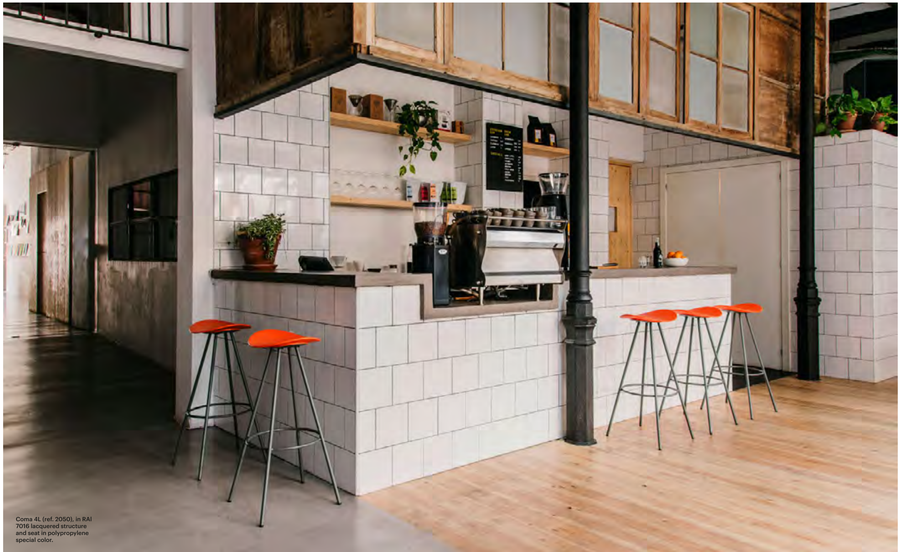
Coma 4L (ref. 2050), in RAI 7016 lacquered structure and seat in polypropylene special color.