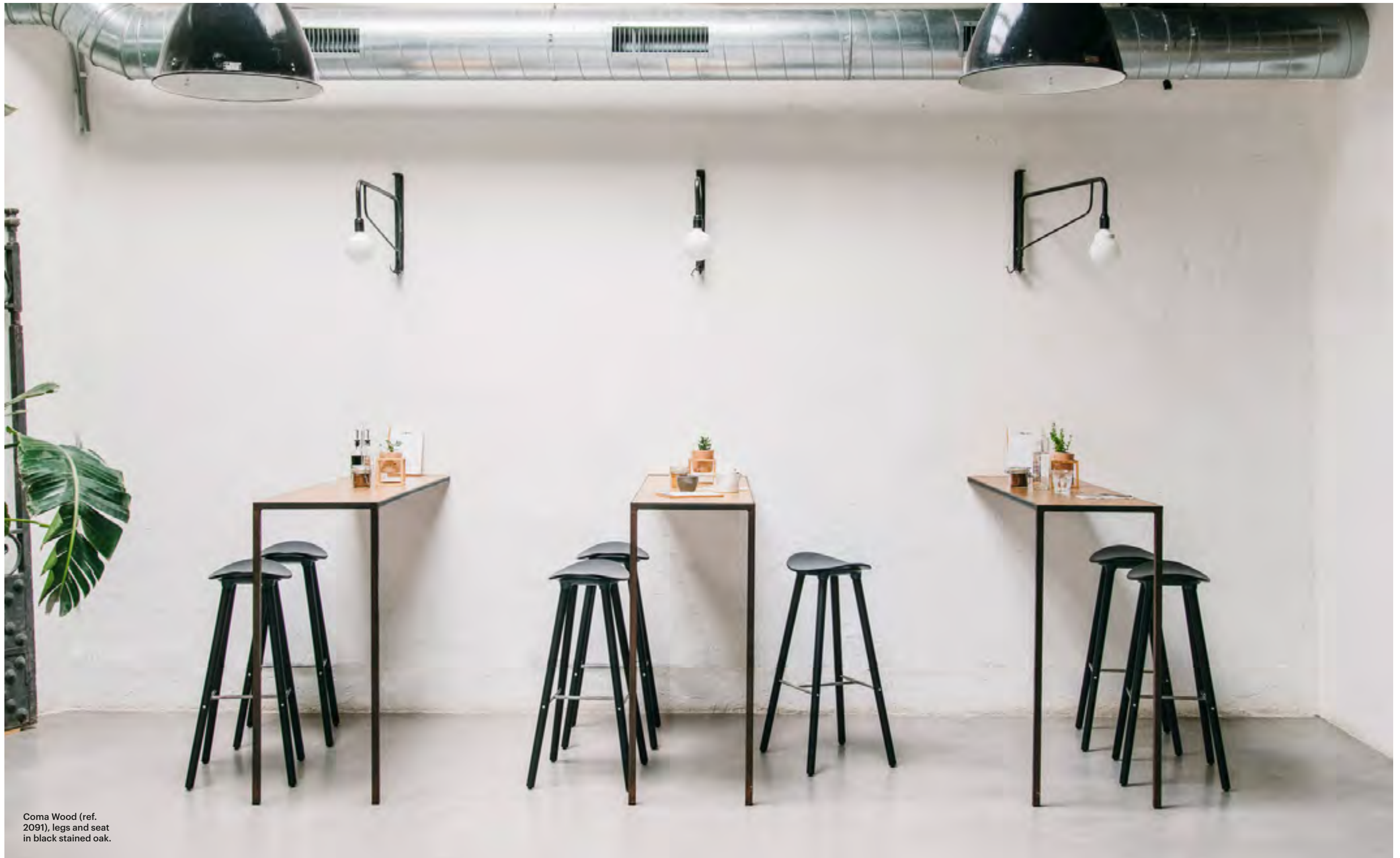
Coma Wood (ref. 2091), legs and seat in black stained oak.