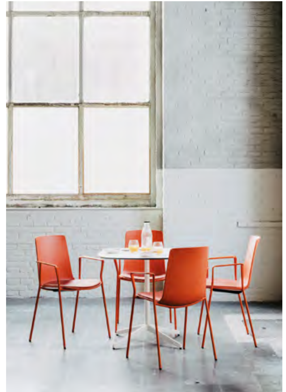
Lottus AL table (ref. 4947), lacquered structure in RAL 9016 and white HPL top. Lottus High (ref. 6200).