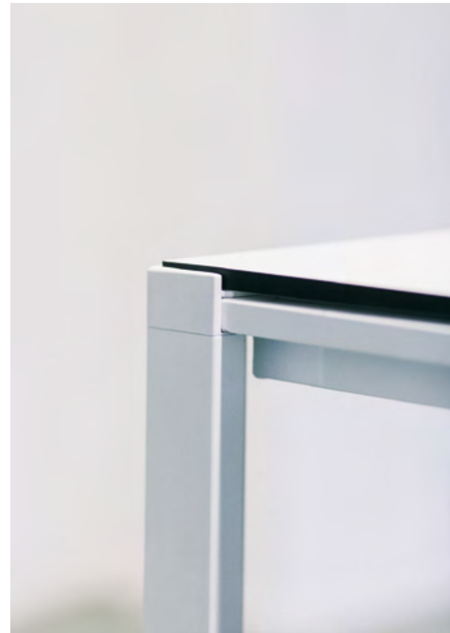
On the left: Eina chairs (ref. 0415) lacquered in RAL 9005 and upholstered in Fame 66133 and 67068. Used with Way.

Concealed accessories such as cable trays and table wings mean Way maintains a deceptively minimal appearance, even under heavy use.