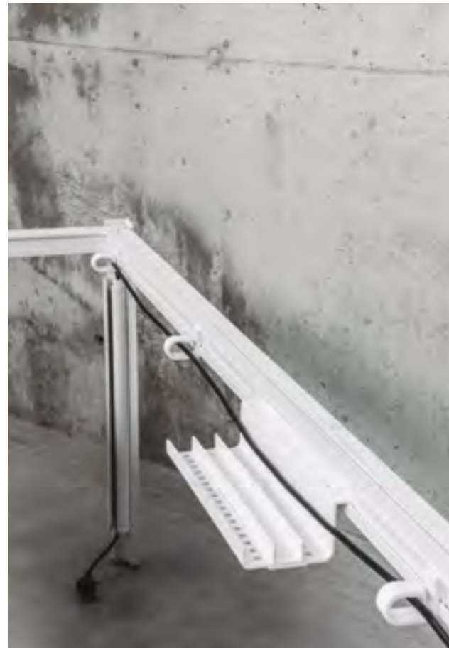
Cable tray, clamp bushing and cable leg, all in RAL 9016 polypropylene.

Way's aluminium structure adds lightness as well as making it easy to combine the tables. The great variety of accessories can be easily incorporated into the table in order to cover multiple office needs. Coming in a wide range of epoxy and lacquered colours, they can also be customised according to individual needs.