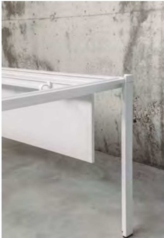
Way table with RAL 9016 lacquered structure, and top and side panel in White laminate.