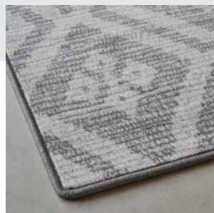
Festonneren / Surjet / Kettelung / Overedging