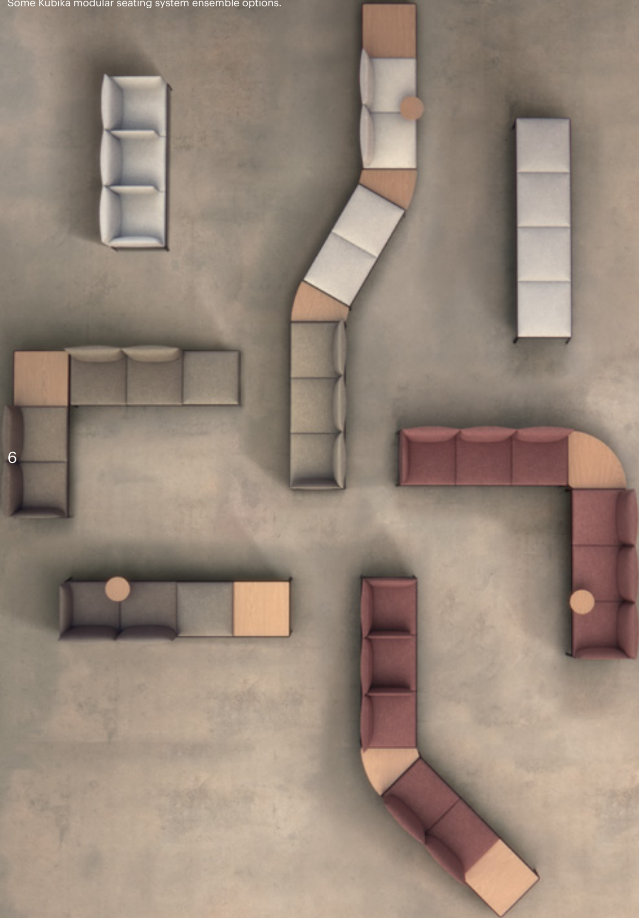
Some Kubika modular seating system ensemble options.