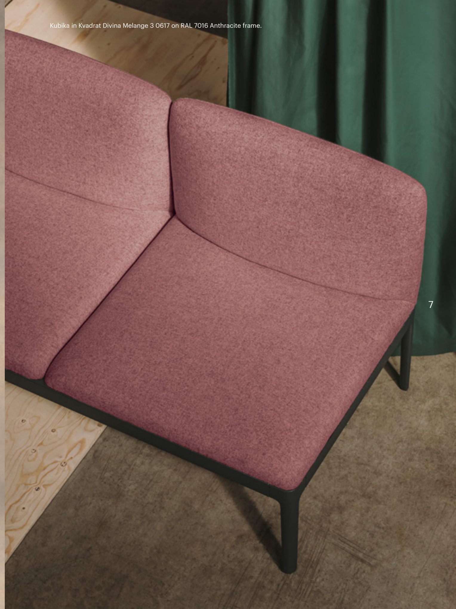
Kubika in Kvadrat Divina Melange 3 0617 on RAL 7016 Anthracite frame.